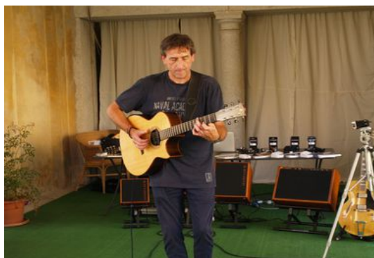
Concerto di Beppe Gambetta (2015)